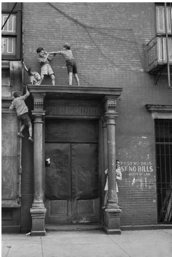
NEW YORK. 1939