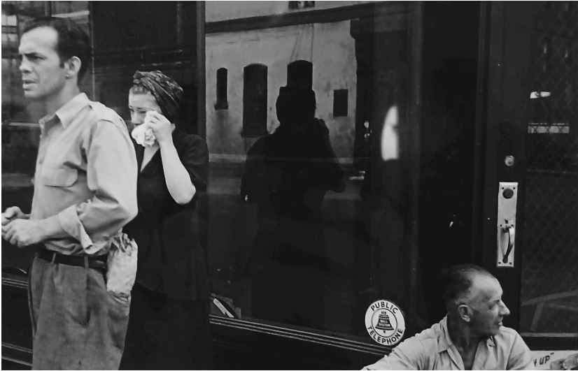
NEW YORK. 1948